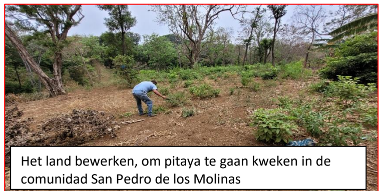
Het land bewerken, om pitaya te gaan kweken in de comunidad San Pedro de los Molinas

In 2023 is dit project formeel afgerond. De boeren zijn ondersteund met workshops om milieubewuster en efficiënter te werken met zaadgoed. Verandering van klimaat is zichtbaar en regen is niet altijd meer een constante factor waarop gerekend kan worden. Dit betekent dat irrigatie ook steeds meer een thema gaat worden en ook een zorgpunt is voor de continuïteit. Onze partner in Duitsland, Jena, probeert nu fondsen te verkrijgen om ECO projecten in deze richting op te starten.