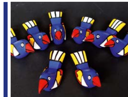
Dat kleurige balsahouten vogeltje uit Nicaragua

U steunt er het werk mee van Helmond - San Marcos