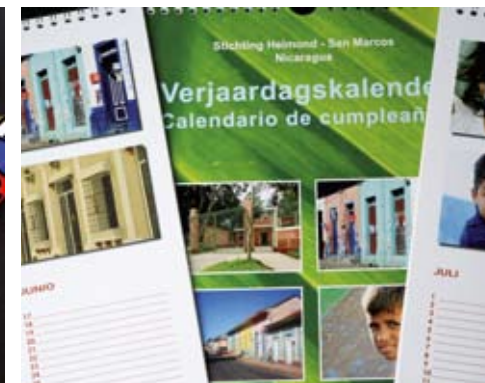
Of die mooie verjaardagskalender

Deze publicaties worden gesponsord door: