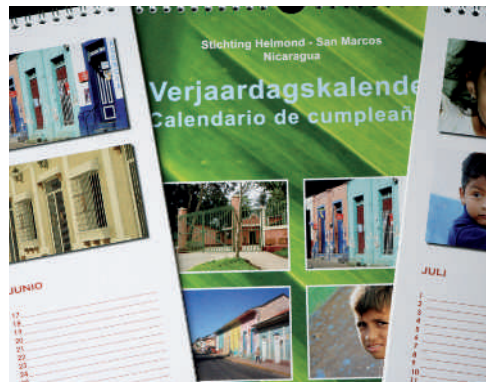
Of die mooie verjaardagskalender

Deze publicaties worden gesponsord door: