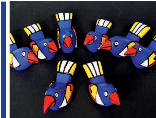
Dat kleurige balsahouten vogeltje uit Nicaragua

U steunt er het werk mee van Helmond - San Marcos